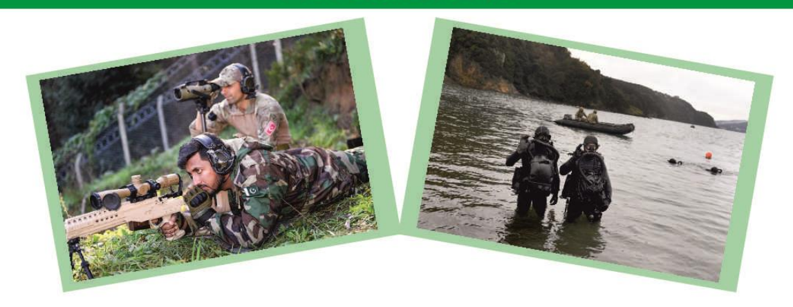
AYYILDIZ-2021\ was\ conducted\ with\ the\ participation\ of\ Pakistan\ Navy\ SSG\ Teams\ and\ Turkish\ Navy\ SAT\ Teams\ in\ December\ 2021.

AYYILDIZ-2021 Tatbikatı Aralık 2021'de Pakistan Donanması SSG Birlikleri ve Türk Donanması SAT Birliklerinin katılımıyla düzenlendi.